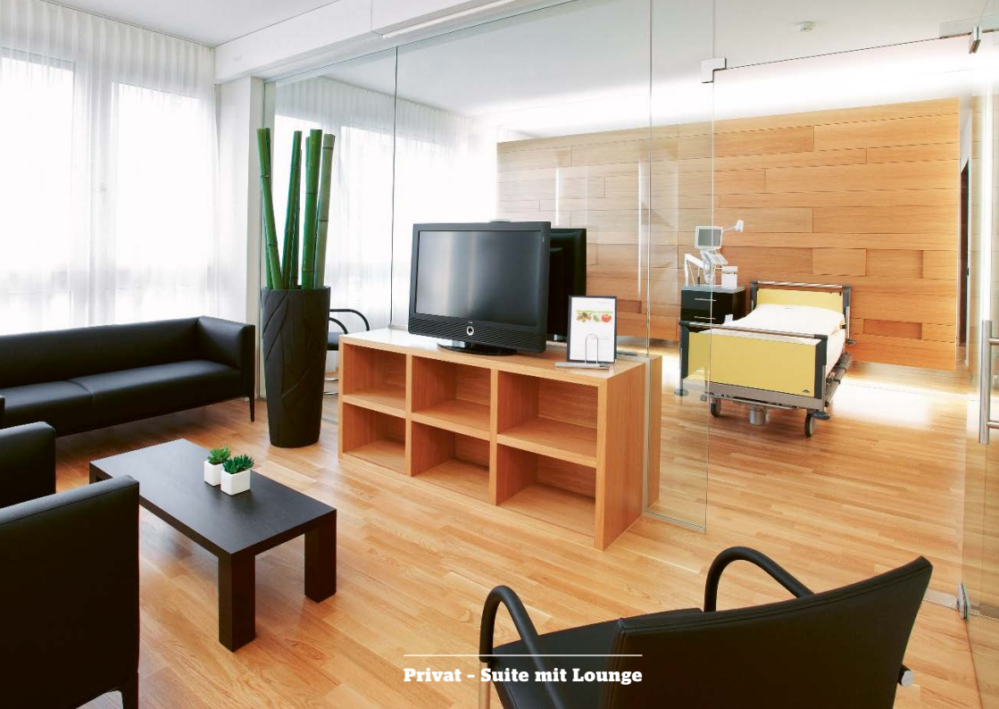
Privat - Suite mit Lounge