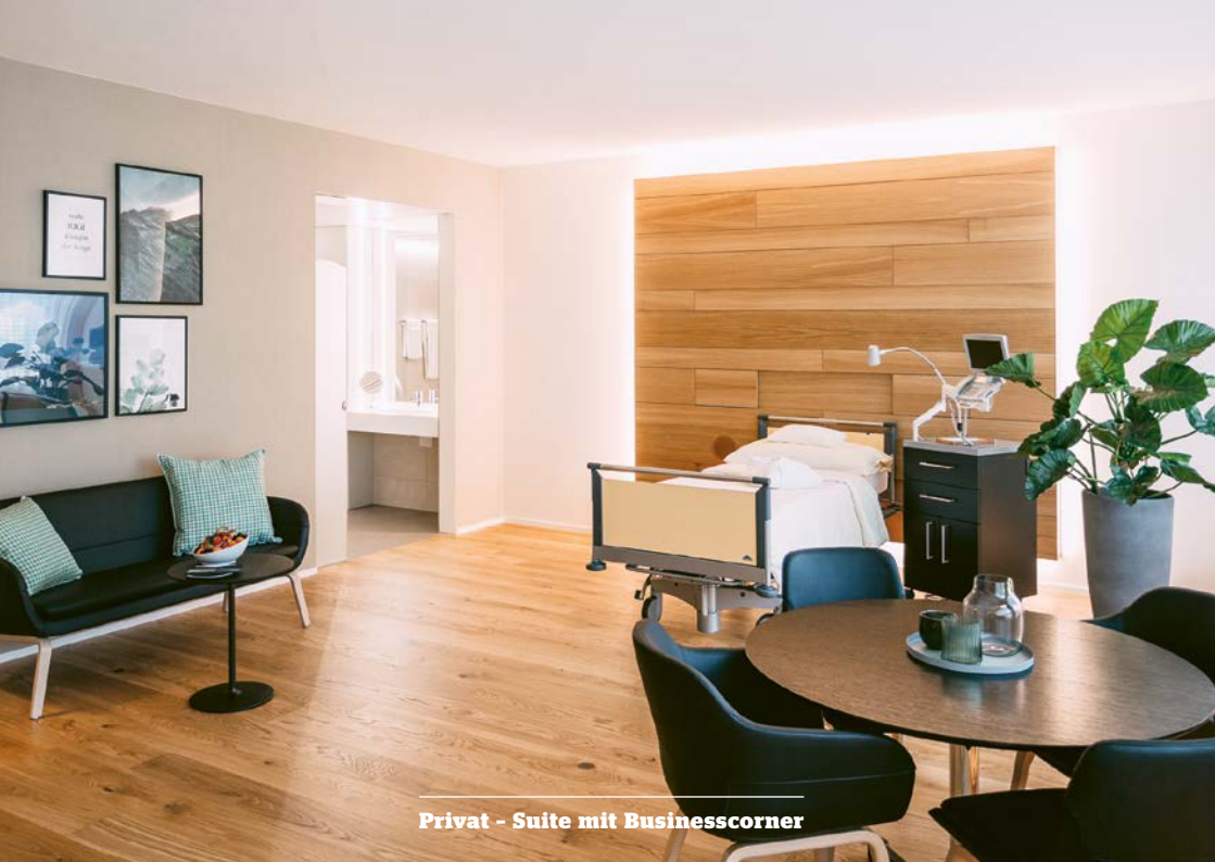
Privat - Suite mit Businesscorner